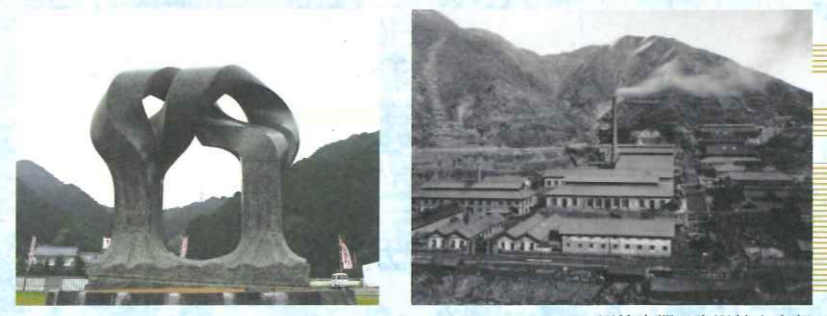
明治中期の生野鉱山本部