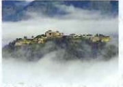
竹田城跡