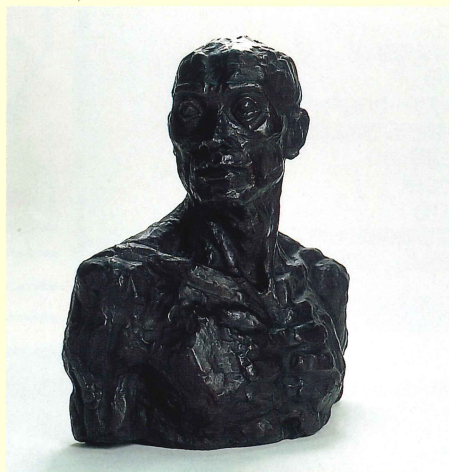
男の胸像(1929年) Bust of a Man

彫刻家淀井敏夫の作品を中心に朝来市主催の各種公募展の受賞作品のほか広く美術資料などを系統的に収集しています。