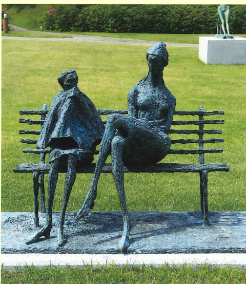
ローマの公園(1976年) Park in Rome