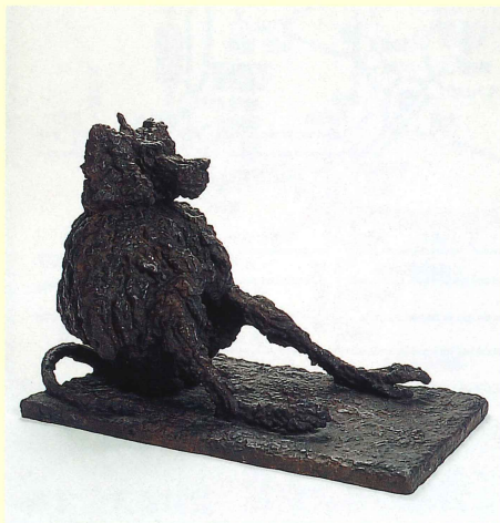
聖マントヒビ(1966年) Sacred Baboon