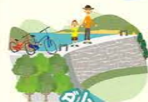
ダム ココデから見える「多々良木ダム」 ダムの上からの絶景がオススメ。